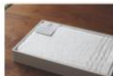
バスタオル1枚 (ギフト対応可) 2枚セット / 2枚セット ¥5,500 サイズ: 370cm x 110cm 重量: 110g