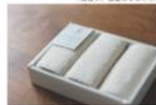
【ミニタオル3枚セット】(ギフト対応可) 2枚セット ¥2,510 サイズ: 270cm x 110cm 重量: 110g