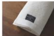
フェイスタオル 1枚 ¥1,450 サイズ: 370cm x 110cm 重量: 110g