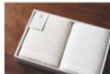
フェイスタオル2枚セット (ギフト対応可) 2枚セット / 2枚セット ¥3,850 サイズ: 370cm x 110cm 重量: 110g