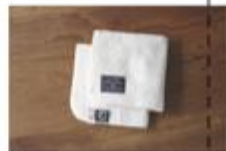
【ミニタオル】 2枚セット ¥600 サイズ: 270cm x 110cm 重量: 110g