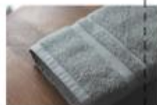
バスタオル1枚 (ギフト対応可) 2枚セット ¥5,500 サイズ: 370cm x 110cm 重量: 110g