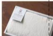
フェイスタオル1枚 (ギフト対応可) 2枚セット ¥1,980 サイズ: 370cm x 110cm 重量: 110g