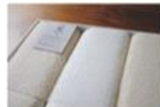
フェイスタオル3枚セット (ギフト対応可) 2枚セット / 2枚セット ¥5,500 サイズ: 370cm x 110cm 重量: 110g