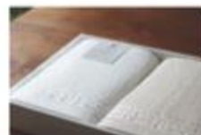
バスタオル2枚セット (ギフト対応可) 2枚セット / 2枚セット ¥11,000 サイズ: 370cm x 110cm 重量: 110g